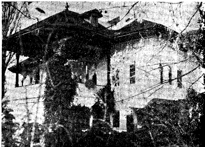
Casa cea mare din complexul Bellu — Urlați

La marginea dinspre nord a Urlaților, pe unul din aceste frumoase dealuri, pe la mijlocul secolului trecut, membri ai familiei Bellu, porniți din Pindul Macedoniei, trecînd prin Italia, unde își italianizează numele care devine Bellio, și apoi prin Austria,