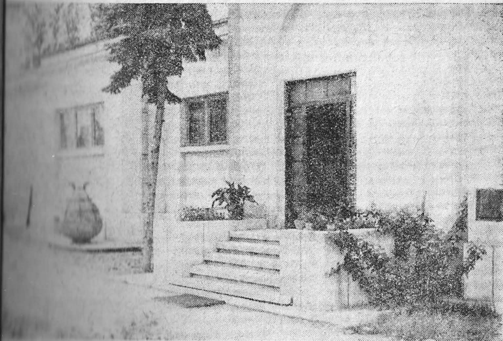
Muzeul Regional de Istorie