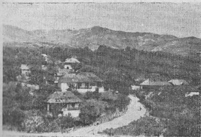
Star-Chiojdul : vedere generală

Cînd s-au mărit feciorii, cel mai mare și-a făcut gospodărie