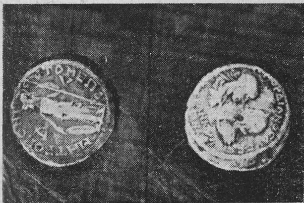
Monetă grecească bătută de orașul Tomis, găsită în Star-Chiojd